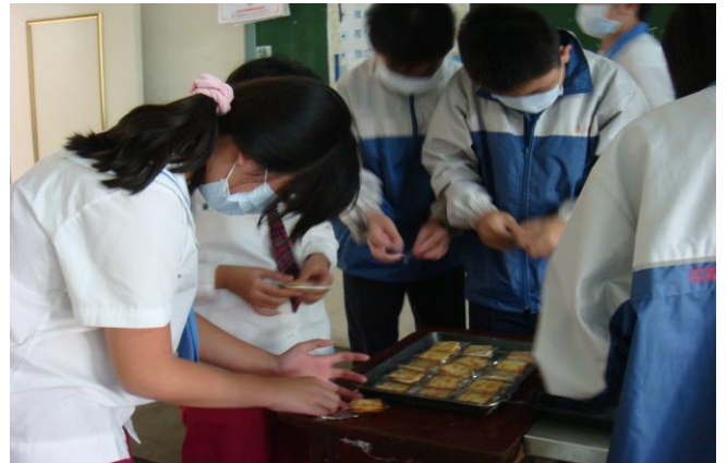
製作奶 Q 餅 102.11.18